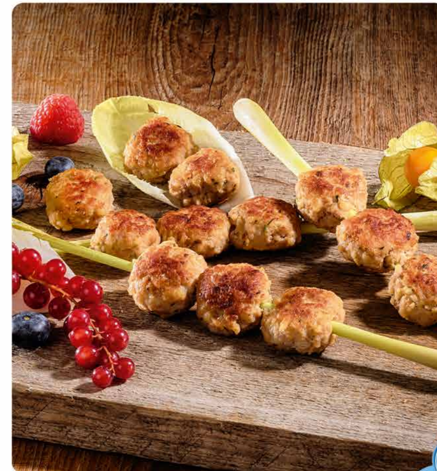
Mini-Party-Geflügelfrikadelle, ca. 15 g, ohne Fett gebraten, I.Q.F., tiefgefroren

Mini-Partyfrikadelle aus Geflügelfleisch von mittelfeiner Körnung, vereinzelt Zwiebelstücke, Kräuter und Gewürze erkennbar, ohne Fett gebraten, I.Q.F., im Schlauchbeutel verpackt