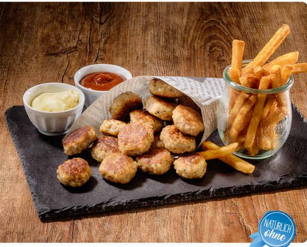
Mini-Partyfrikadelle, ca. 15 g, ohne Fett gebraten, I.Q.F., tiefgefroren

Aus Schweine- und Rindfleisch von mittelfeiner Körnung, vereinzelt Zwiebelstücke, Kräuter und Gewürze erkennbar, ohne Fett gebraten, I.Q.F., im Schlauchbeutel verpackt