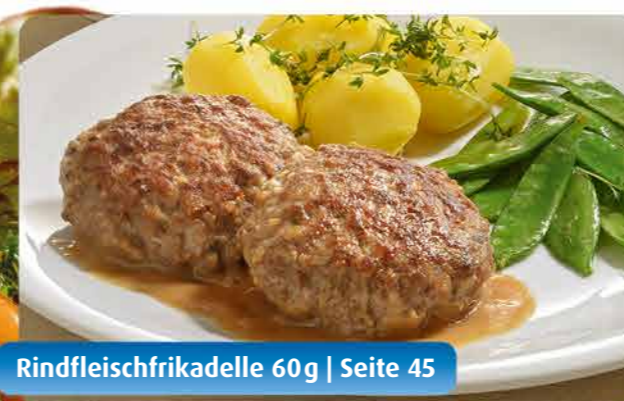
Rindfleischfrikadelle 60g | Seite 45