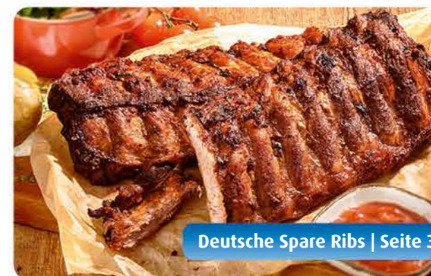
Deutsche Spare Ribs | Seite 32