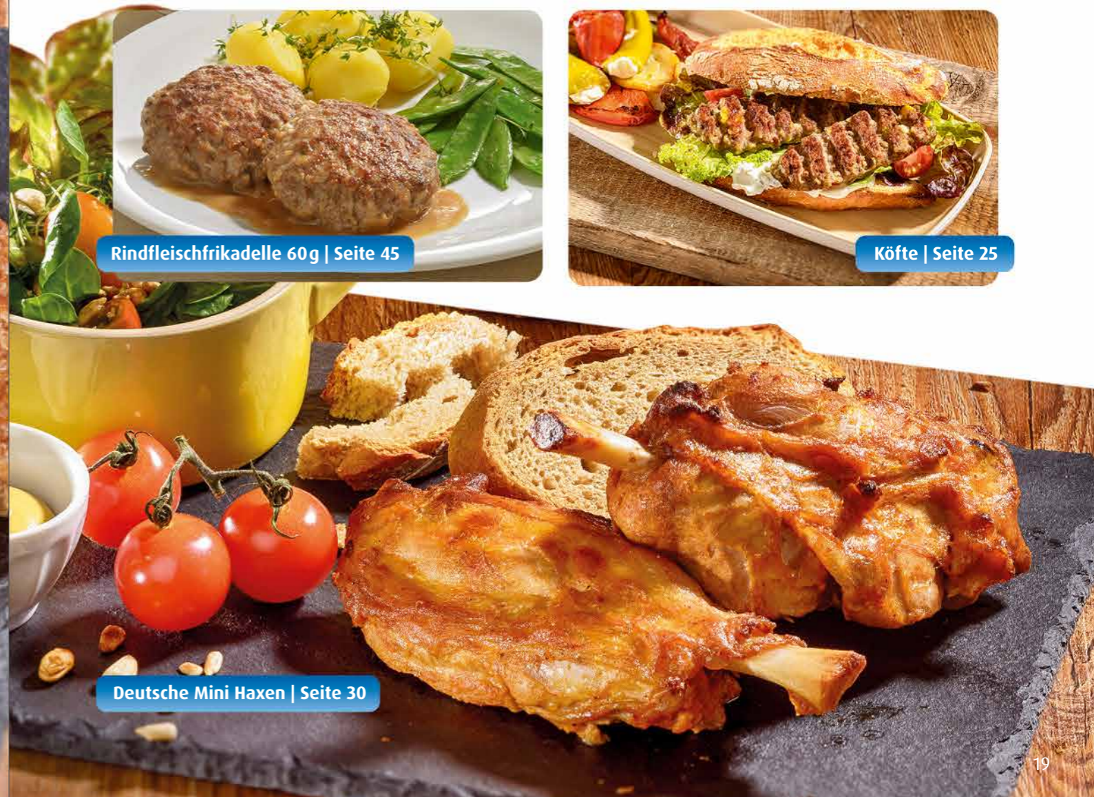
Deutsche Mini Haxen | Seite 30