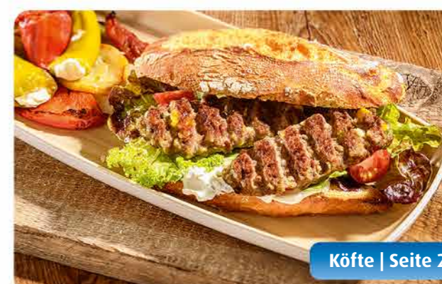
Köfte | Seite 25