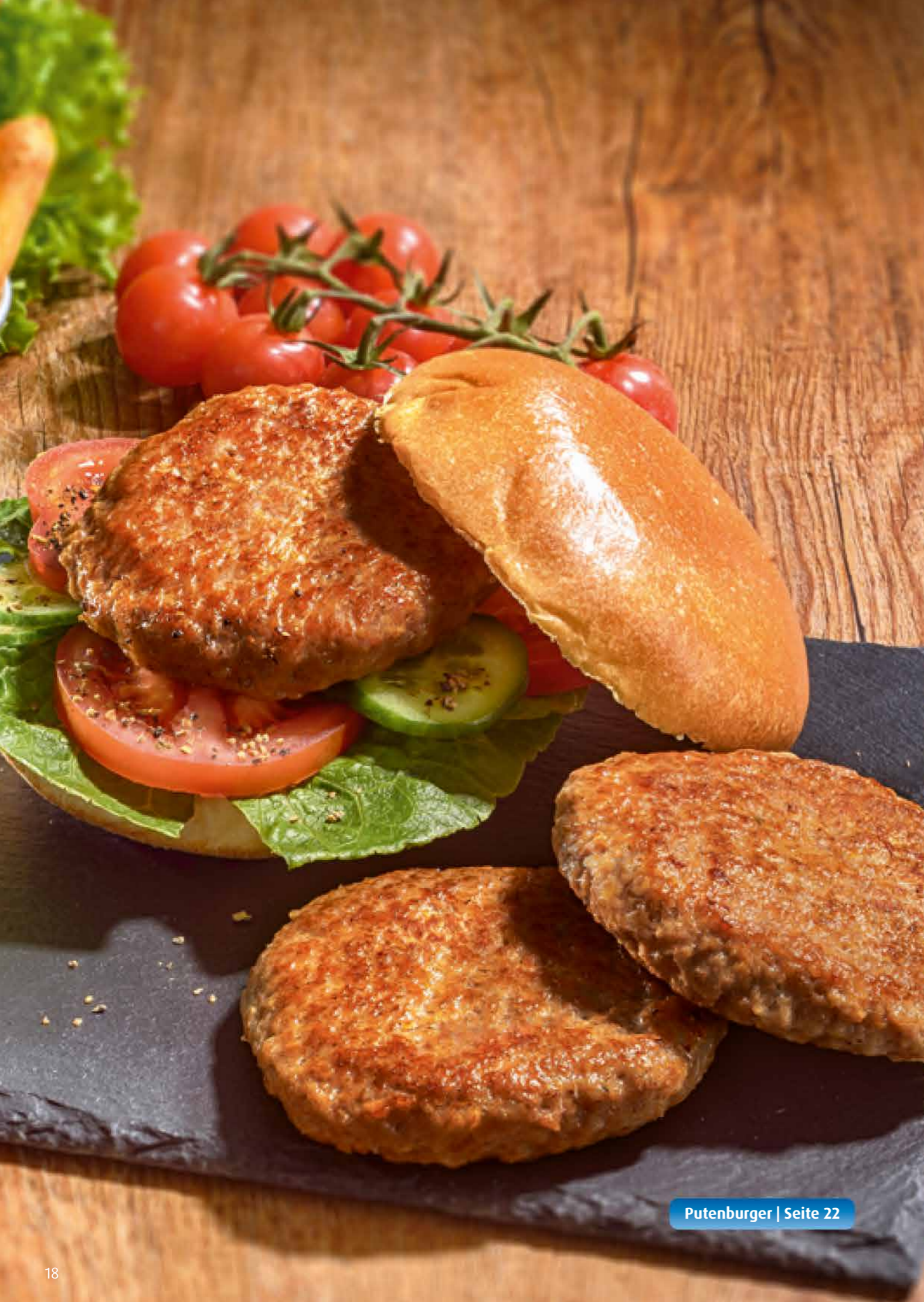
Putenburger | Seite 22