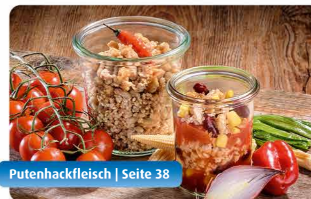
Putenhackfleisch | Seite 38